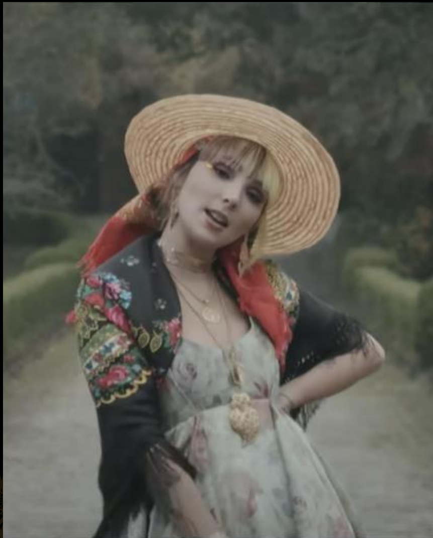
Claudia Pascoal – Videoclip Quase dança