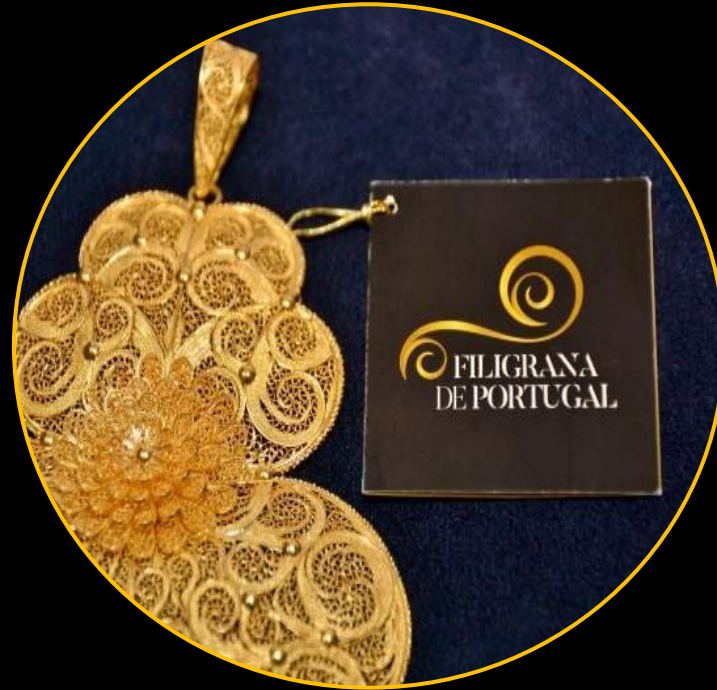
Acrescentar valor ao produto