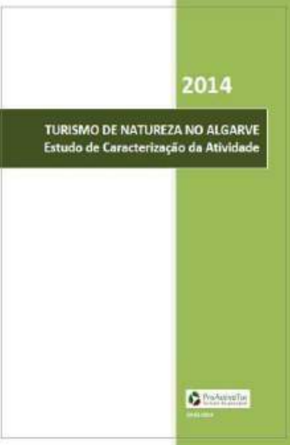
Região de Turismo do Algarve, 2014