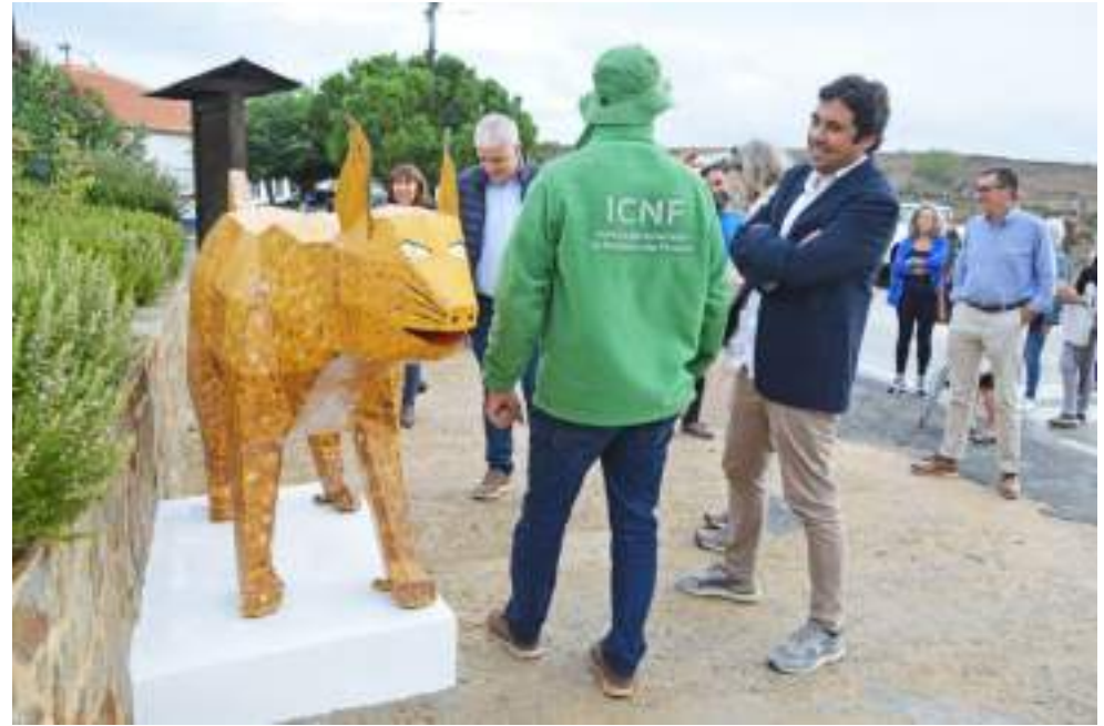
Projecto “Aldeias do Lince” – sensibilização para a conservação do Lince-Ibérico através da arte e do envolvimento das comunidades