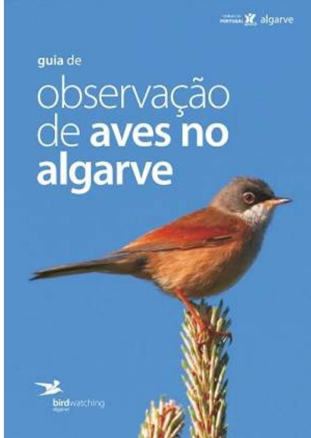
Região de Turismo do Algarve, 2017