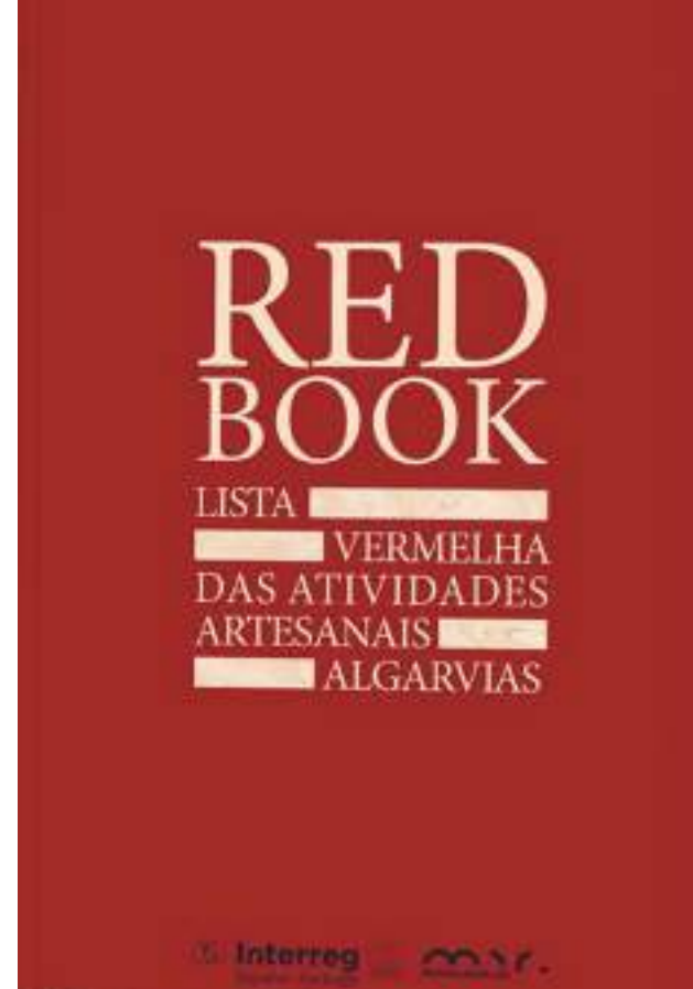
CCDR Algarve, 2022