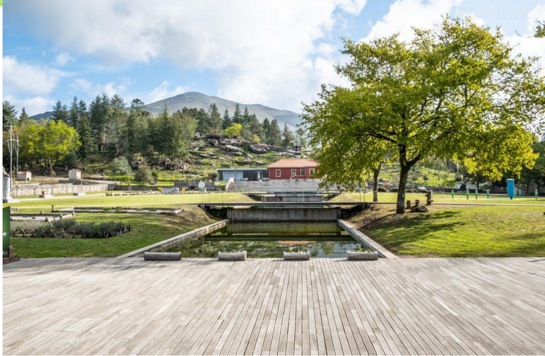
Porta do Mezio – Arcos de Valdevez - PNPG