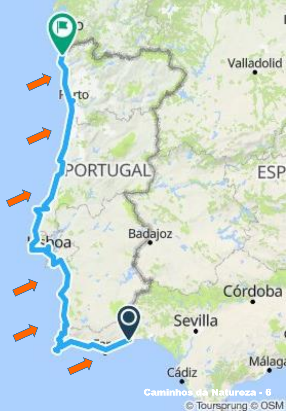
Caminhos da Natureza - 6