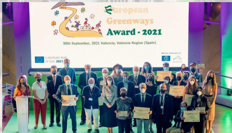
Cerimónia Entrega Prémios