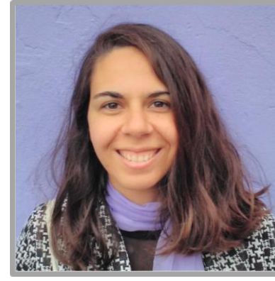
Liliana Nóbrega Arquitetura