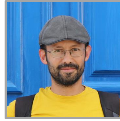
José Lima Arquitetura