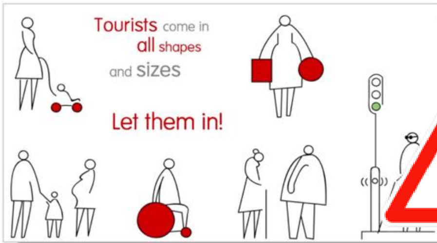
Tourists come in all shapes and sizes (OSSATE, 2005)