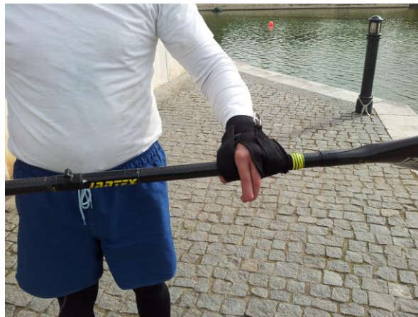
bandas de velcro que aderem às pagaias ou remos