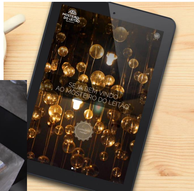
Ementas em Braille e App com conteúdos acessíveis