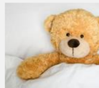
Dust Mite Allergy