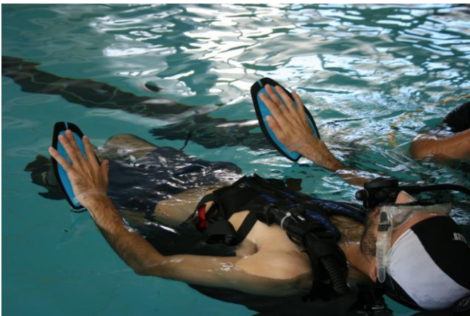
“luvas de pato” luvas com membrana inter-digital