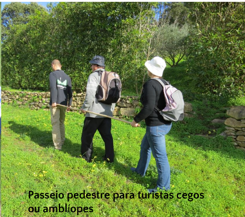
Passeio pedestre para turistas cegos ou amblíopes