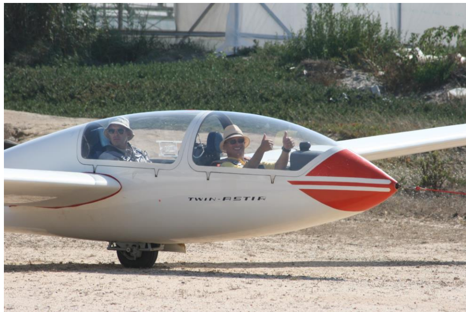
Passeios aéreos em planador