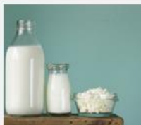
Cow's Milk Allergy