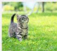
Animal Hair Allergy