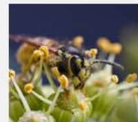
Insect Venom Allergy