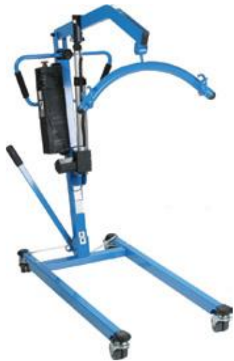
Grua de transferência