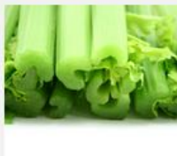
Celery, Cherry & Co. – Cross Reactivity