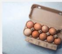
Chicken Egg Allergy